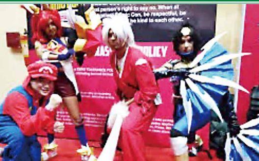
インドの先端都市バンガロール